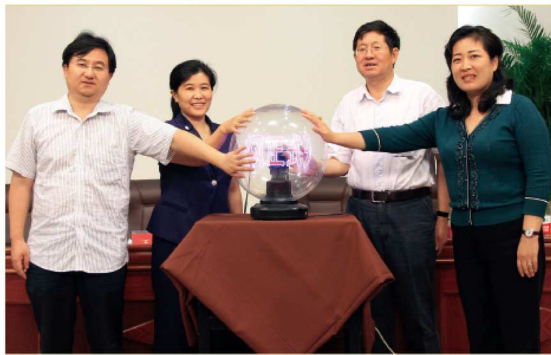
北京外国语大学英语教师培训科研网正式开通。

后跟踪调查数据显示,教师对培训的满意率总体达到100%,表示“非常满意”者也高达85%以上。优质的培训质量和良好的口碑让“俄语工程”受到了各地政府的欢迎。延安市教育局、湖南省教育厅和广西壮族