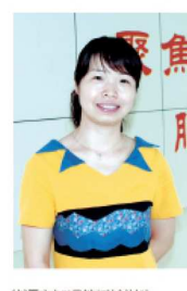
的语言知识教授给学生。 文/天津市河东区教育中心 赵丽茹

5.要树立终身学习的信念。对于英语教师来说,世界政治、经济、文化、科技等方面的变化都影响着语言的发展。英语教师必须时刻学习,了解语言的发展变化,将最新