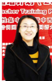
文/山东淄博实验中学 郭淑红

他告诉我们,教师要像将“教学”上升到“教育”,从“教育”的高度看待英语教学,去开发、启迪学生的心灵。张连仲教授指出,外语教师要努力成为一名“智识分子”,不仅要具备较好的语言能力,还应具备良好的语言教学能力和职业发展能力。张教授的讲座也引起了我的深思。的确,我们只有具备良好的综合素质,才能成为真正优秀的教师。