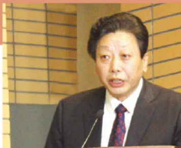
外国语学院 FOREIGN STUDIES UNIVERSITY

目前,国内留学培训市场秩序混乱、鱼龙混杂,黑中介严重侵害学生合法权益的现象屡见不鲜。我们希望政府相关部门能够加大力度严厉打击那些违规的留学培训机构,进一步规范留学服务市场。作为业内人士,我们不希望看到损害消费者利益的恶性竞争。