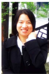
2011年11月10日至25日,我有幸被广东省教

育厅选中,参加了由教育部组织、北京外国语大学承办的“国培计划”研修项目。在15天的学习过程中,我们先后聆听了多位专家教授和中学名师的讲座。学习的过程虽然辛苦,但我们感到很快活,因为我们行走了一路,收获了一路,思索了一路。