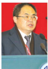
鲁子国: 国家《英语课程标准》研制专家组成员、全国基础外语教育研究培训中心副理事长、华中师范大学教授、《英语》(新标准)小学和初中教材中方副主编

2. 注重思想性、科学性、趣味性和灵活性结合的原则。《英语》(新标准)在修订时坚决贯彻《课标》提出的思