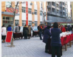
与会人员正在浏览课题资料及课题成果。

学英语教师向来自全国百余所学校的领导和老师们分享了一堂三年級英语课,授课教师采用外研社出版的小学义务教育《英语》(新课标)点读教材以及配套的外研通点读笔,给学生营造出了地道、真实的英语环境。阳谷实验小学学生们标准的英语发音和流畅的口语表达使与会教师们感到非常震撼。