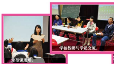
学校教师与学员交流。