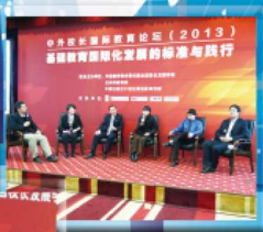
中外校长国际教育论坛(2013) 基础教育国际化发展的标准与践行