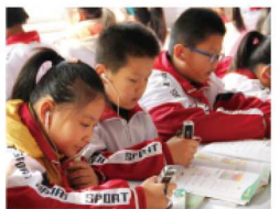
阳谷实验小学学生用外研通点读笔上课。