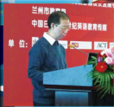
兰州市教育局 中国日报社21世纪英语教育传媒