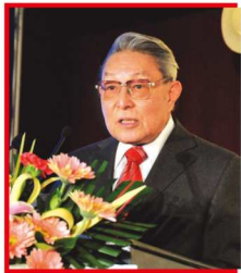
陈琳:北京外国语大学教授、国家《英语课程标准》研制与修订专家组组长

当然,我们现在重点谈到的是课外阅读。正如你刚才所说,你们通过调研发现,包括北上广深等大城市在内,全国80%的英语学习者在课外进行英语阅读的时间很短,仅有不到10分钟。不仅如此,他们的阅读量也很小,阅读的内容也主要是习题集。这是件很不幸的事情。这里面的一个重要原因就是我们的学生负担太重。要从根本上解决这个问题,我们应该大力呼吁教师和家长尽可能给学生多一些自主学习、自主阅读的时间。现在的学生不是在活泼的气氛中获得知识,而是在课堂上按照老师的要求来学习,在课外按照老师的规定来做作业,还有一些学生在课外培训班上做习题集,这样他们就没有时间来进行达到人文性目的的阅读。对中小學生而言,在条件允许的情况下,进行课外阅读的时间当然是越长越好。