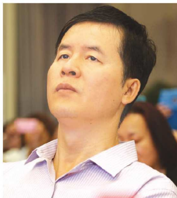
中国教科院副院长曾天山

建设题库是一项功在当代,利及后人的大工程。建设高考题库可以从根本上提高高考的质量和效率,保证难度系数,又降低成本,维护国家考试的权威和声誉。