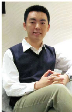
好未来教育集团副总裁白云峰